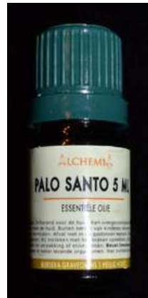
Palo Santo etherische olie