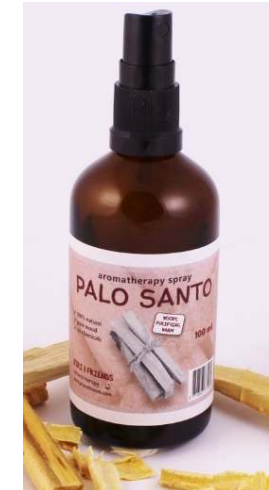
Palo Santo SPRAY